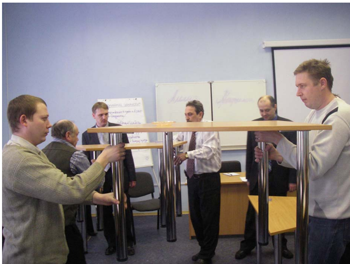
Рисунок 5 Обучение взаимодействию